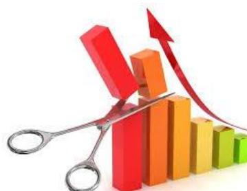
Problemi nel calcolo dei consumi