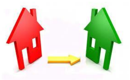
Cambio di residenza