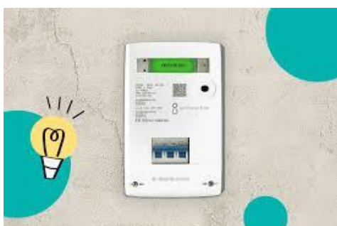
Guasto del contatore