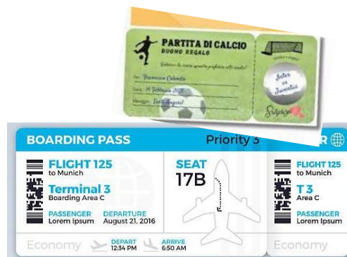
Tempo libero oltre alla partita